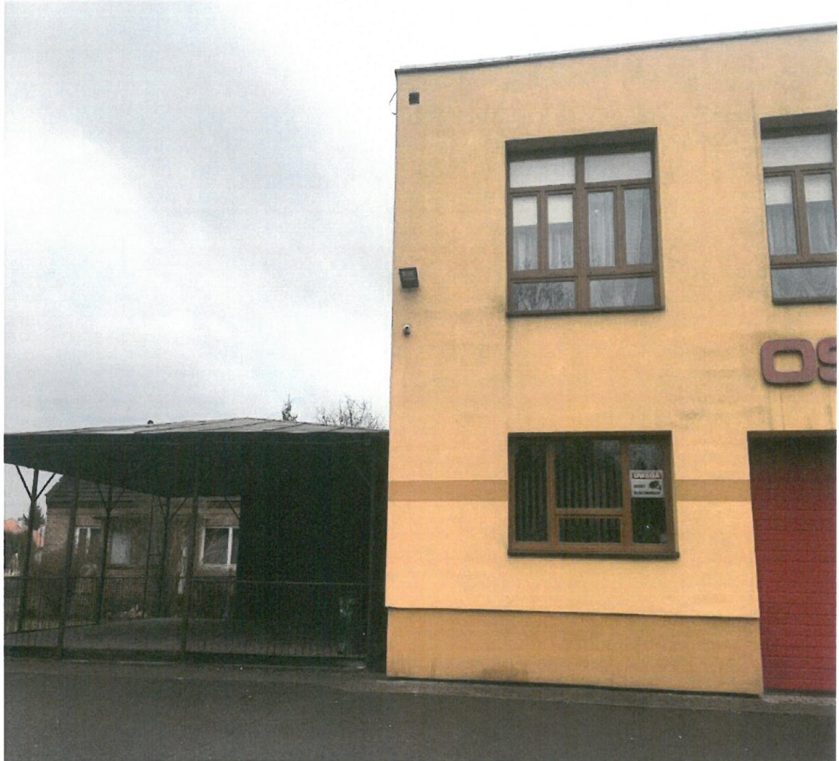
WDK w Rozborzu wraz z podłoga taneczną