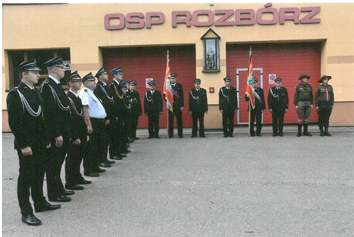
74 – rocznica wybuchu powstania warszawskiego przed WDK w Rozborzu ,1 sierpnia 2018 r.