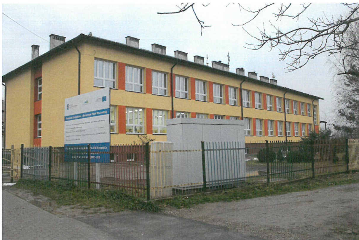
Szkoła Podstawowa w Rozborzu