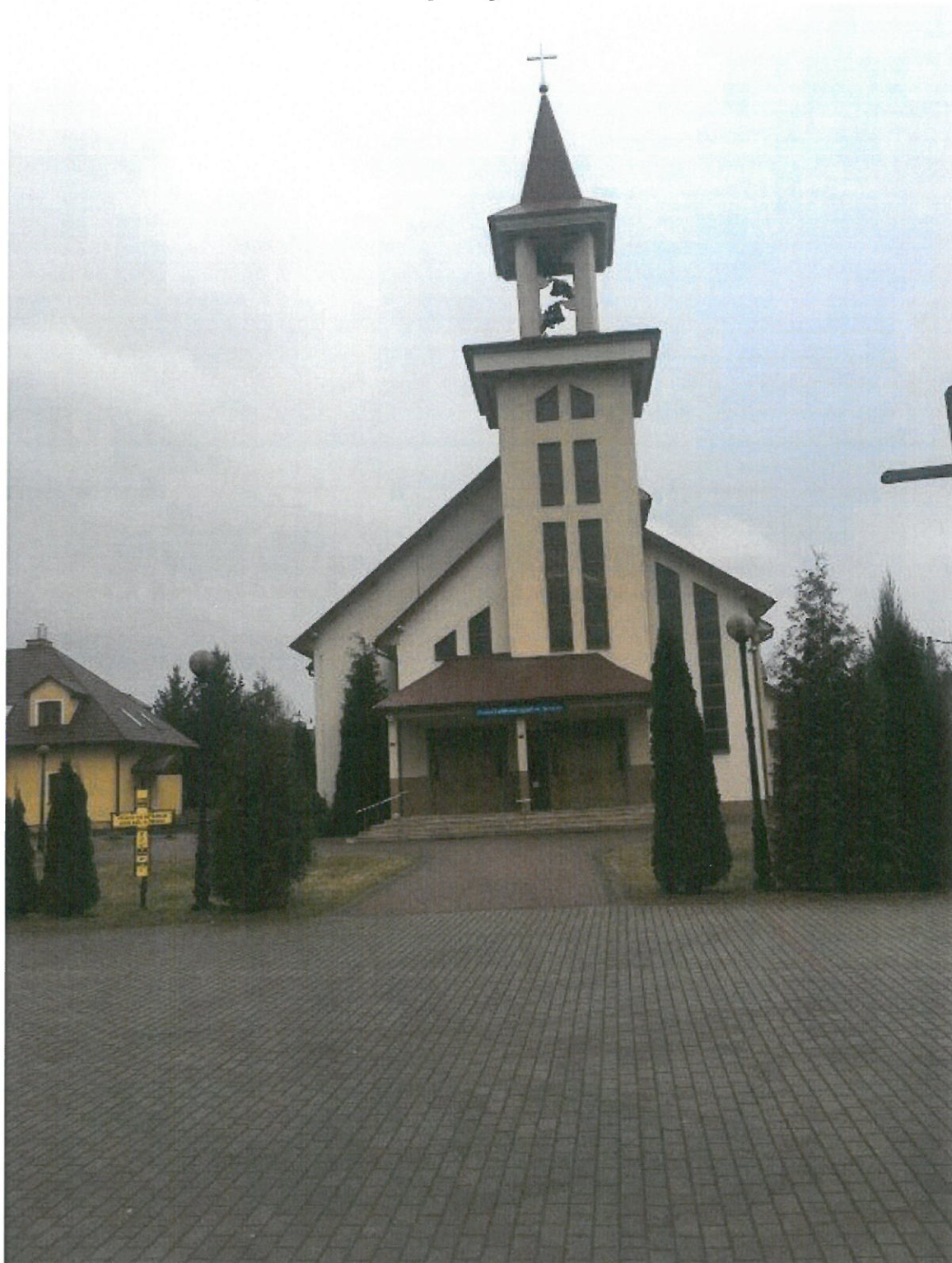
Kościół Parafialny w Rozborzu