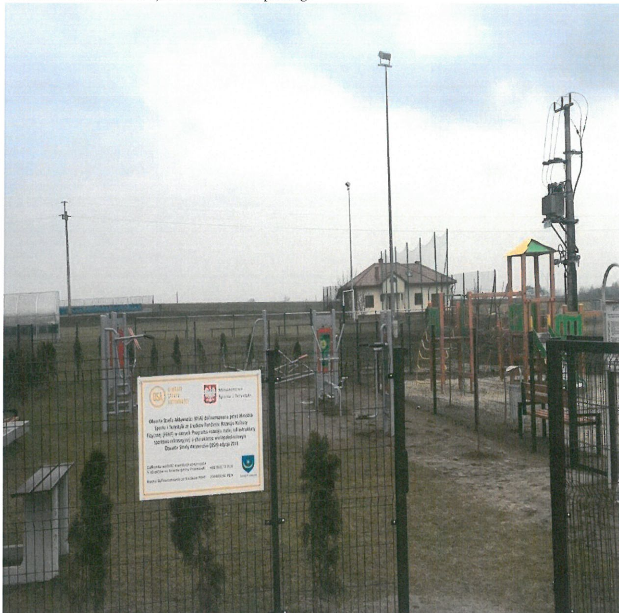
Otwarta Strefa Aktywności w Rozborzu